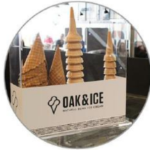
Waffelspender Plexiglass // 60 €