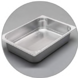
Eisschale 5 L 360x250x80mm // 10 €