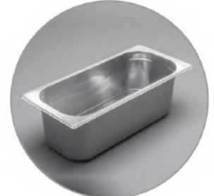
Eisschale 5 L 360x165x120mm // 10 €