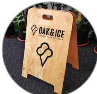
Passantenstopper 60 €