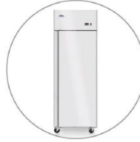
Tiefkühlschrank Hendi Profi Line 670 L // 890 €