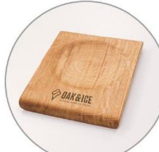
Geldteller aus Holz 15 €