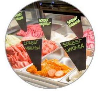
Eissortenschilder 2,50 € pro Stück