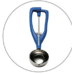
Eisportionierer Stöckel K40 1/40 // 30 €