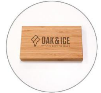
Geldmappe aus Holz 15 €