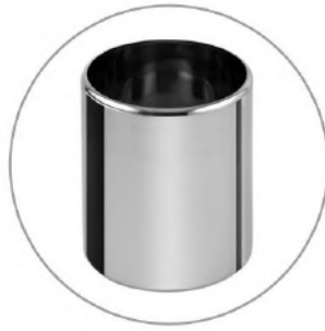
Eisbehälter rund Pozzetti 7,2 L // 25 €