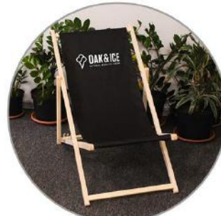
Liegestuhl 25 €