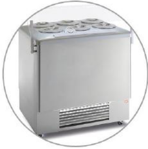
Pozzetti Eisvitrine Festival X Inox 6 Eissorten // 3.190 €