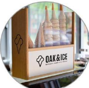
Waffelspender aus Holz 75 €