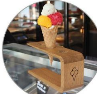
Waffelhalter aus Holz 25 €