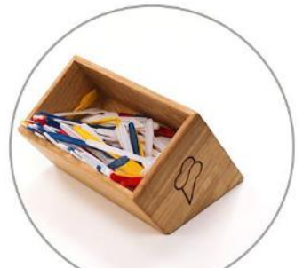
Eislöffel Spender aus Holz 25 €

Zubehör aus Holz mit OAK & ICE Logo - Wartezeit je nach Verfügbarkeit auf Vorrat. Zubehör aus Holz mit eigenem Logo - Wartezeit von 2 bis 4 Wochen, Preis + 20%. Die angegebenen Preise sind Nettopreise (19% MwSt.). Die vorliegende Preisliste hat lediglich hinweisenden Charakter und ist kein Angebot im Sinne von Art. 66 § 1 des pol. Bürgerlichen Gesetzbuches. Die Verfügbarkeit von Produkten hängt vom aktuellen Lagerbestand oder der Verfügbarkeit von Produkten unserer Lieferanten ab. Jedes Mal informieren wir Sie über die Möglichkeit, eine bestimmte Bestellung abzuschließen.